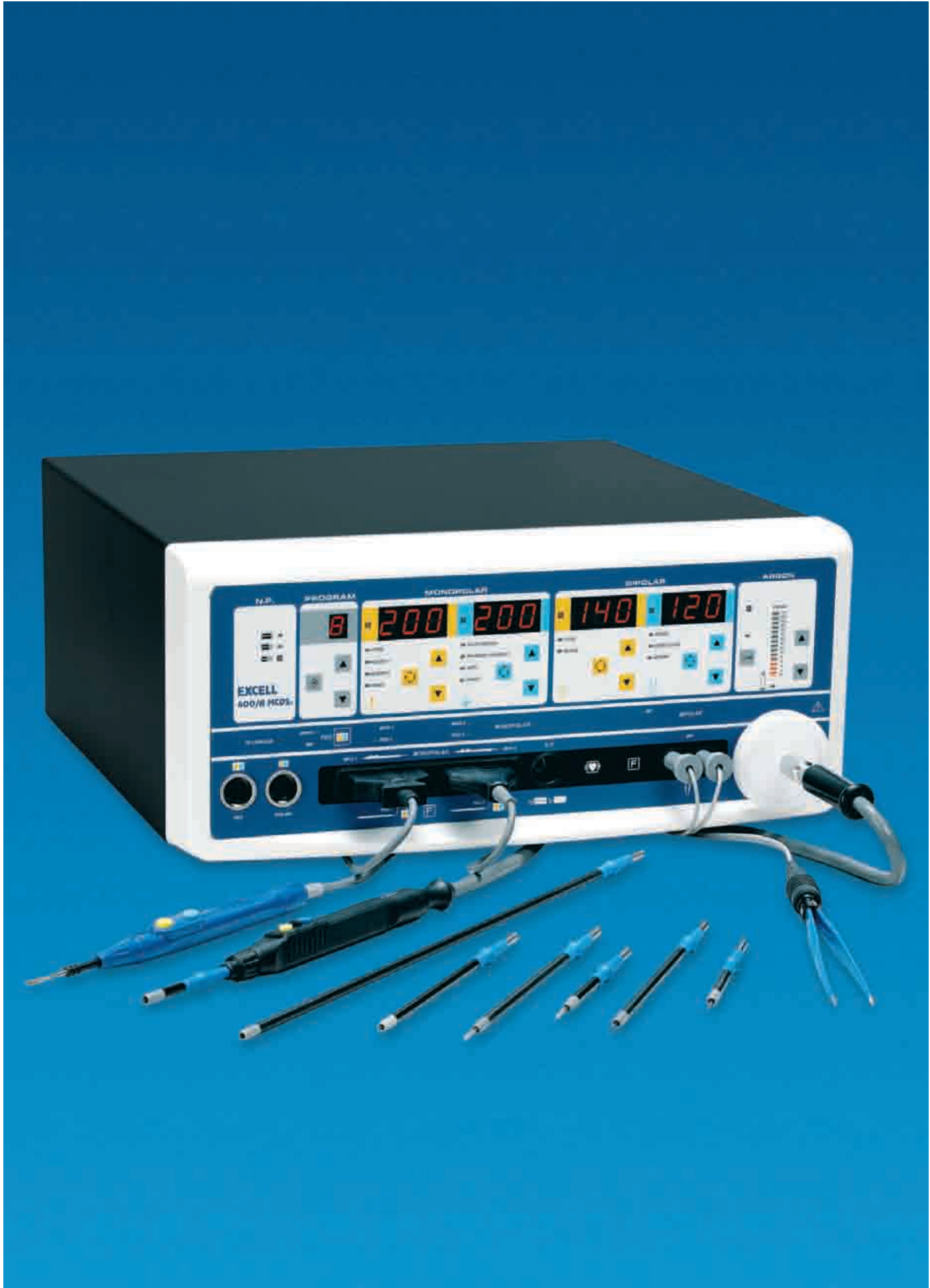
EXCELL 400/A MCDSe